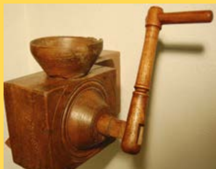
Moulin à blé noir breton

Une collection de petits moulins domestiques ou artisanaux : une fenêtre ouverte sur la diversité des usages, mais surtout l'envie de faire découvrir au visiteur la spécificité et le génie de chaque instrument, en lui proposant des clés de compréhension.