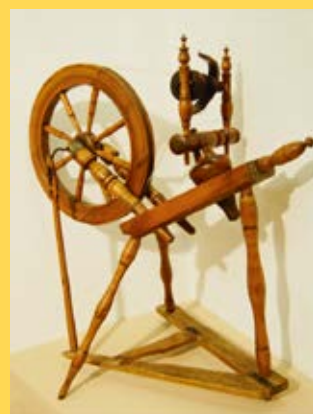
Rouet à pédale