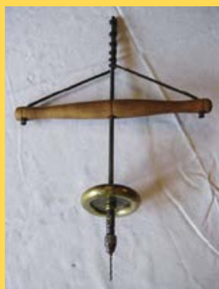
Trépan de bijoutier