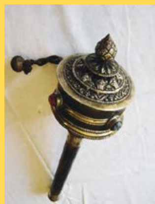
Moulin à prière tibétain