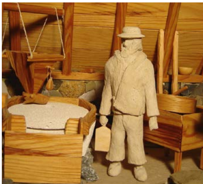
Dans un moulin pyrénéen