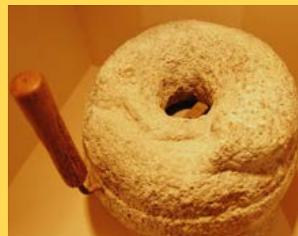
Moulin à sel auvergnat