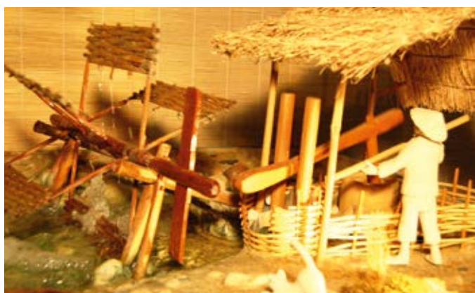
Décorticage du riz au Viet Nam