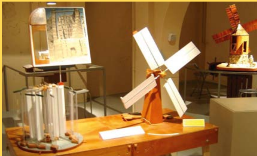
Des ailes modulables pour expérimenter

La visite du musée fait appel à tous les sens. Il se découvre avec les yeux, avec les oreilles, mais aussi avec les mains, car la plupart des maquettes sont manipulables. Ainsi grâce à des ailes malléables dont on modèle la forme et les angles d'incidence à loisir, chacun peut découvrir comment des ailes peuvent tourner. On peut également s'exercer sur une maquette d'étude pour comprendre comment fonctionne un moulin à marcher ou encore découvrir la vis d'Archimède dont l'inclinaison, la vitesse de rotation et le niveau d'eau du bassin de puisage sont réglables. Cette vis est indissociable de la présentation du petit moulin de pompage hollandais « Paaltjasker » dont la vis se cache dans un tonneau en bois.