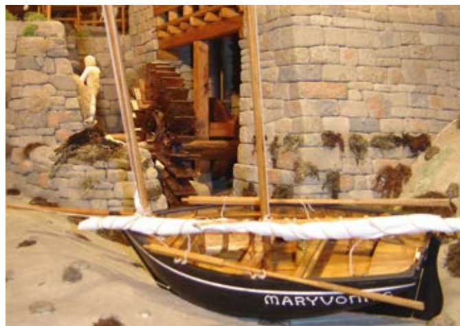
Moulin à mer de Traoumeur (Côtes d'Armor)