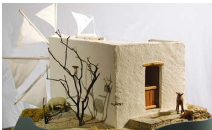
Sur l'île grecque de Karpathos

Tout cela au son du clapotis de l'eau sur les roues, du bruissement des ailes qui tournent en cadence, du chant des engrenages ; les rouets cliquètent dans les lanternes, les babillards vibrent sur les axes, les maillets soulevés par les cames chutent et rechutent inlassablement. Près de vous une maquette tourne lentement sur elle-même pour vous montrer tous ses atouts. Tout cela dans une mise en lumière subtile et intime mêlant ombres et reflets. Concentré sur la rotation d'une vis d'Archi-