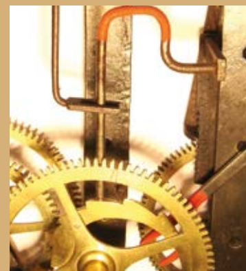
Le limaçon d'une horloge comtoise