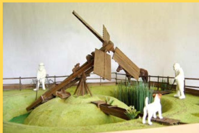
Moulin de prairie hollandais « Paaltjasker »

Le musée a souhaité renforcer cette particularité par la fabrication de nouvelles maquettes didactiques destinées spécifiquement au public scolaire. Leur conception est en cours.