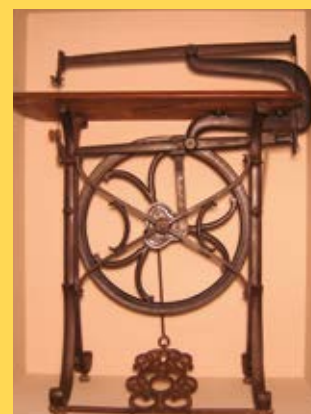
Scie sauteuse de marqueteur