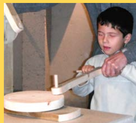
Expérimenter les multiples manières de mettre un axe ou une roue en rotation

La géographie y a aussi toute sa place : on s'intéresse notamment aux liens entre le moulin et les composantes du territoire sur lequel il est implanté : le climat, les ressources naturelles, les pratiques architecturales, etc.