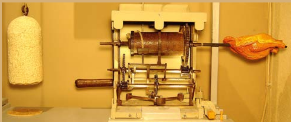
Tournebroche à contrepoids, qui fonctionne à la demande