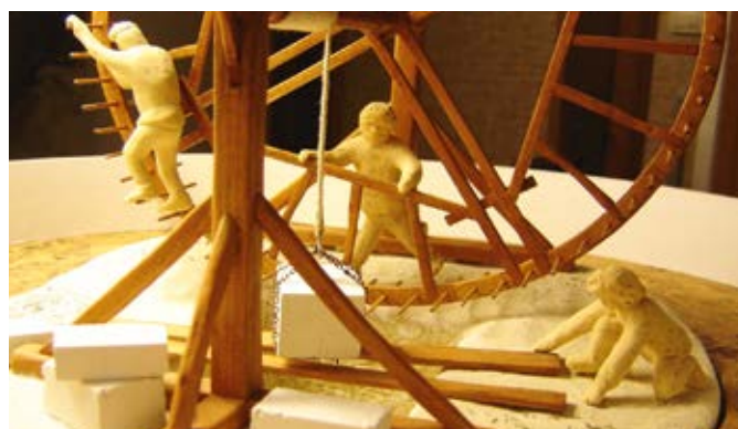
Roue de carrier : carrières de Paris

mède transparente que manipule un jeune visiteur, vous sur-sauterez soudain au déclenchement de la sonnerie de l'horloge à poids, ou bien de l'alarme du tournebroche à contre poids. Mais pourquoi une horloge ou un tournebroche dans cet espace dédié aux moulins ? Il s'agit d'un choix délibéré du sens donné au mot « moulin » : « Toute machine ou instrument dans lequel un mouvement de rotation est généré à partir d'une énergie naturelle humaine, animale, hydraulique ou éolienne, puis utilisé pour entraîner un ou plusieurs outils au service d'un travail ». Un concept qui va donc au-delà des seuls instruments ou machines appelés moulins. Sortant des sentiers battus des maquettes traditionnelles, chaque maquette est le résultat d'une longue réflexion sur son positionnement dans l'histoire et la technique des moulins. Vous allez donc découvrir dans ces lieux les mille et une manières de mettre la roue en œuvre dans de multiples applications, actionner les maquettes animées, vous confronter à des maquettes expérimentales, scruter les mystères des petits moulins à main et à pied. Vous vous attarderez à votre guise sur les nombreux panneaux richement illustrés de documents d'archives, de photos, de schémas techniques, de reproductions de tableaux de maîtres qui situent chaque maquette dans son contexte.