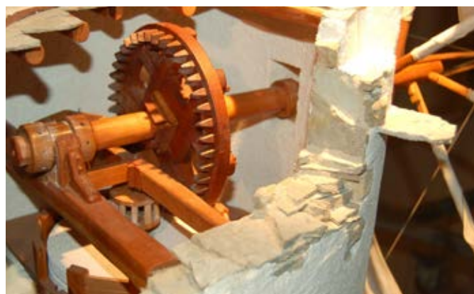
Moulin grec dit « en fer à cheval », détail

mède transparente que manipule un jeune visiteur, vous sur-sauterez soudain au déclenchement de la sonnerie de l'horloge à poids, ou bien de l'alarme du tournebroche à contre poids. Mais pourquoi une horloge ou un tournebroche dans cet espace dédié aux moulins ? Il s'agit d'un choix délibéré du sens donné au mot « moulin » : « Toute machine ou instrument dans lequel un mouvement de rotation est généré à partir d'une énergie naturelle humaine, animale, hydraulique ou éolienne, puis utilisé pour entraîner un ou plusieurs outils au service d'un travail ». Un concept qui va donc au-delà des seuls instruments ou machines appelés moulins. Sortant des sentiers battus des maquettes traditionnelles, chaque maquette est le résultat d'une longue réflexion sur son positionnement dans l'histoire et la technique des moulins. Vous allez donc découvrir dans ces lieux les mille et une manières de mettre la roue en œuvre dans de multiples applications, actionner les maquettes animées, vous confronter à des maquettes expérimentales, scruter les mystères des petits moulins à main et à pied. Vous vous attarderez à votre guise sur les nombreux panneaux richement illustrés de documents d'archives, de photos, de schémas techniques, de reproductions de tableaux de maîtres qui situent chaque maquette dans son contexte.