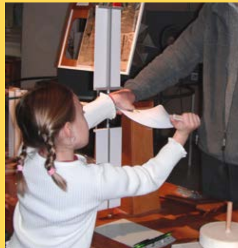
Le village des ailes, un jeu d'enfant