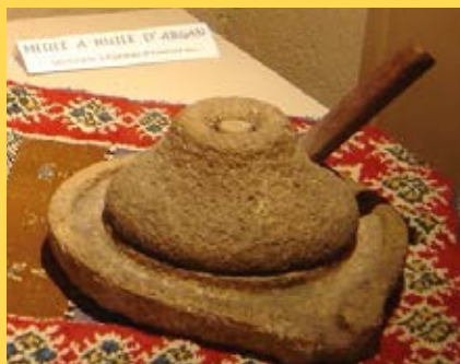
Moulin à huile d'argan marocain