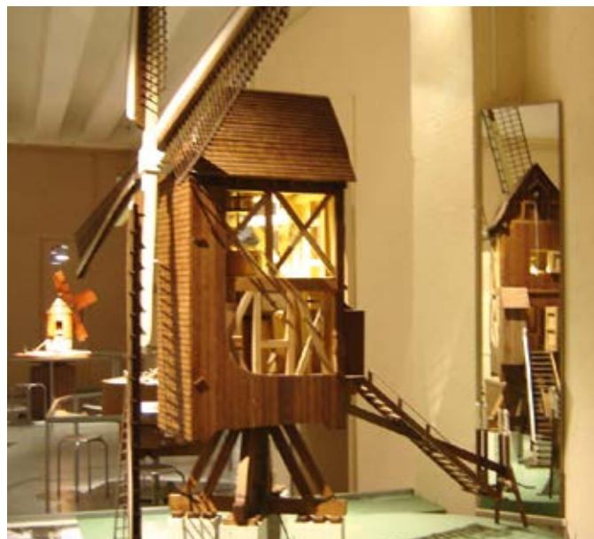
Moulin sur pivot belge (maquette réalisée par Georges Pauwels)